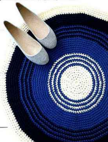
Do it yourself! Tapis de bain au crochet en Phil Corde, points maille en l'air, 51 €, Phildar .