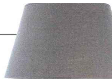
Pied de lampe « Paula », verre et métal argenté, H. 40 cm, 215,50 €, Blanc d'Ivoire.