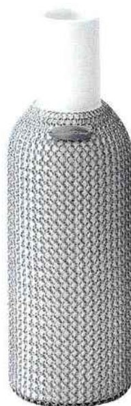
Carafe habillée de mailles en inox, H. 30 cm, 100 cl, 106 €, Le Labo Design .