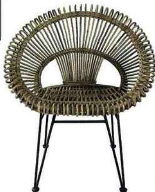
COMME UN SOLEIL. Chaise en rotin tressé, disponible en blanc, 239,90 €, Helline.

Le haut en rotin ou en bois plein, le bas en métal ou en plastique : les meubles osent les mélanges des matières.