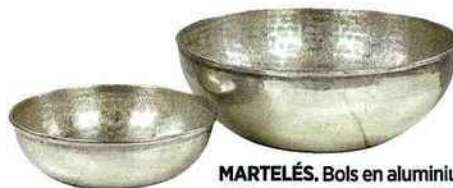
MARTELÉS. Bols en aluminium finition argent, « Vagn », 54 € le set de 2, Broste Copenhagen.