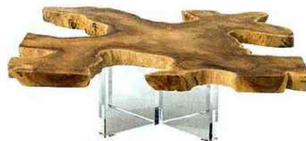
TRONQUÉE. Table basse en teck et Plexiglas, « Thekku », 1925 €, Now's Home.