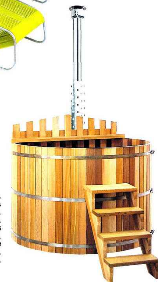
Hot Tub, collection AQUAWOOD, lames en cèdre rouge, cercles de serrage en acier inoxydable. Disponible en deux dimensions. Capacité 1 700 l / 3 à 5 personnes : Ø 183 x H 100 cm. Capacité 1 140 l / 2 à 3 personnes : Ø 152 x H 100 cm. Prix sur demande.