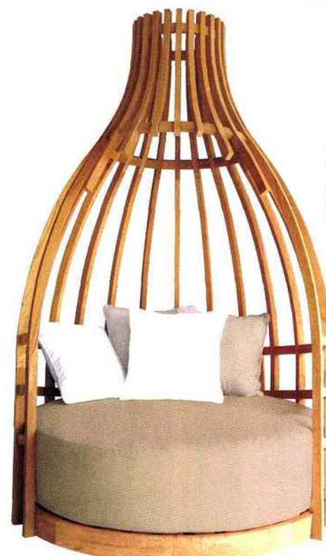
Cocoon Sofa, collection FRÉGATE : en teck couleur naturelle. Tissu Sunbrella taupe et écru. Dim : 140 x 145 x H 248 cm. Prix sur demande.