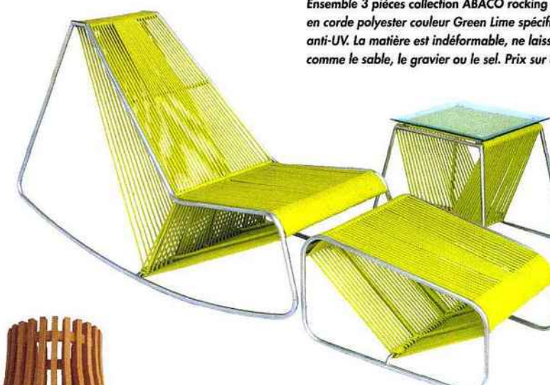
Ensemble 3 pièces collection ABACO rocking chair, repose-pieds et table d'appoint : en corde polyester couleur Green Lime spécifiquement adaptée à l'usage extérieur, anti-UV. La matière est indéformable, ne laissant aucune chance aux salissures comme le sable, le gravier ou le sel. Prix sur demande.