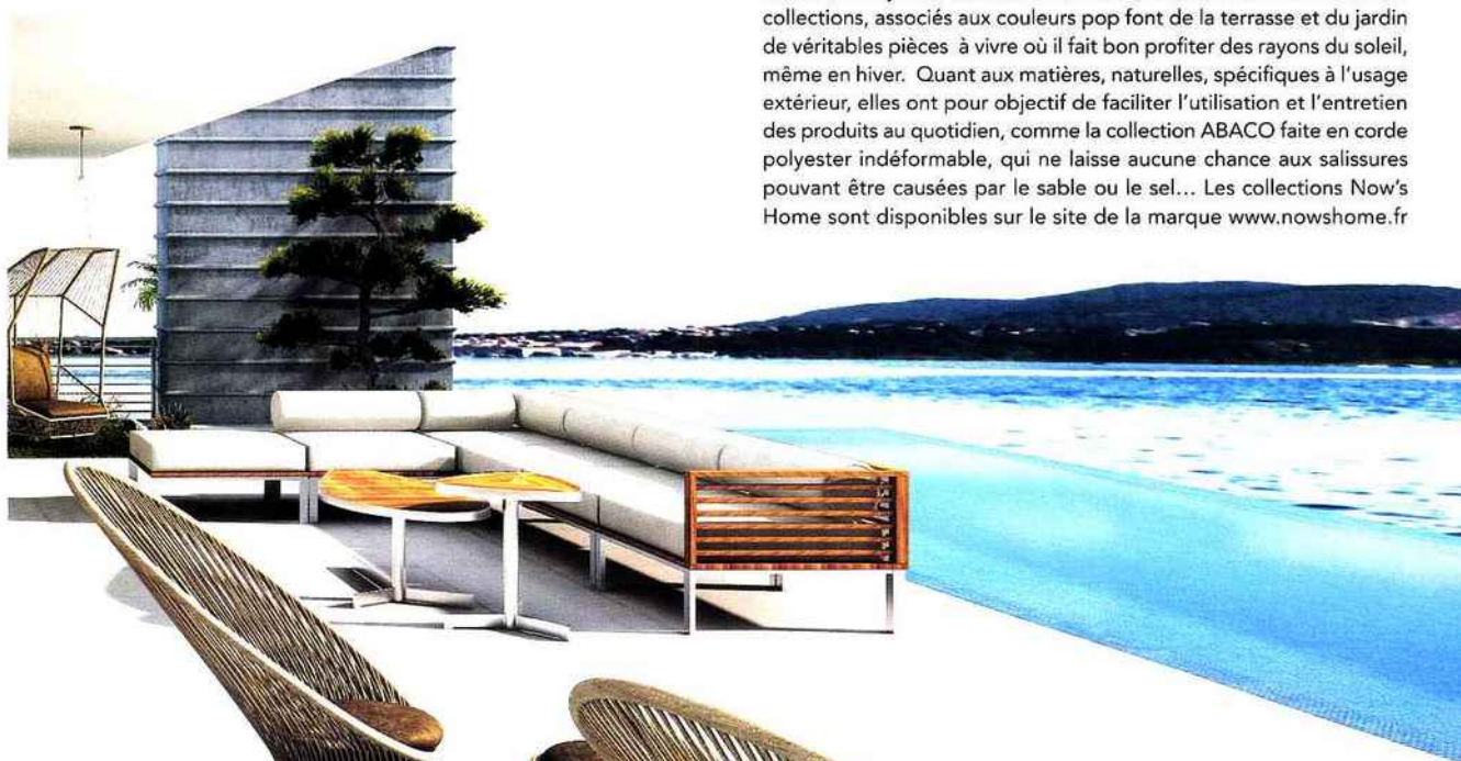
Collection LAGUNA BEACH composée d'un ensemble de trois pièces, fauteuil lounge, table basse et pouf, en corde polyester couleur sable, spécifiquement adaptée à l'usage extérieur, anti-UV, indéformable et antisalissures. Collection BELLE NATURE en teck couleur naturelle, structure en acier inoxydable 304 brossé, coussins et assises en tissu Sunbrella blanc.

La marque française Now's Home portée par sa créatrice Nathalie Levisse, a présenté sa nouvelle collection Outdoor, lors du salon Maison & Objet, à Paris. Forte de son savoir-faire, la marque française a su se démarquer, comme à chaque fois, avec des collections pour l'extérieur, qui mélangent avec subtilité design épuré et matériaux nobles et naturels, le tout articulé autour d'un esprit éco chic, et cocooning, histoire de rester fidèle à la philosophie de sa créatrice, Nathalie Levisse : « J'aime les matières nobles, et suis très attachée au soin et détails apportés aux finitions de mes créations. Chaque détail est important afin de proposer un mobilier luxueux mais jamais ostentatoire. » Les tons chaleureux des nouvelles collections, associés aux couleurs pop font de la terrasse et du jardin de véritables pièces à vivre où il fait bon profiter des rayons du soleil, même en hiver. Quant aux matières, naturelles, spécifiques à l'usage extérieur, elles ont pour objectif de faciliter l'utilisation et l'entretien des produits au quotidien, comme la collection ABACO faite en corde polyester indéformable, qui ne laisse aucune chance aux salissures pouvant être causées par le sable ou le sel... Les collections Now's Home sont disponibles sur le site de la marque www.nowshome.fr