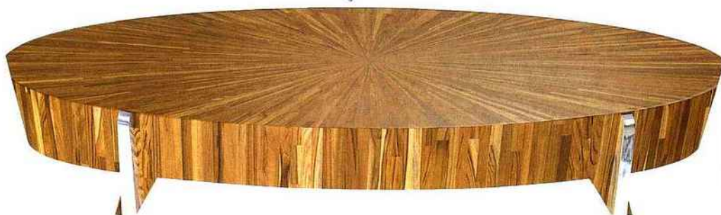
Table basse en marqueterie de teck 100x150x ht 44 cm pieds inox brillant 3500 €

Fauteuil en marqueterie de teck et cuir pleine fleur blanc 90x70x83cm ht pieds en acier inoxydable brillant 2.620 €